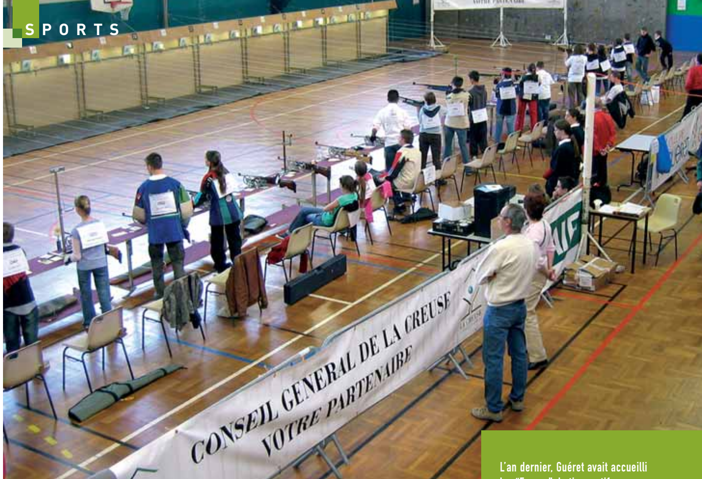
L'an dernier, Guéret avait accueilli les "France" de tir sportif.